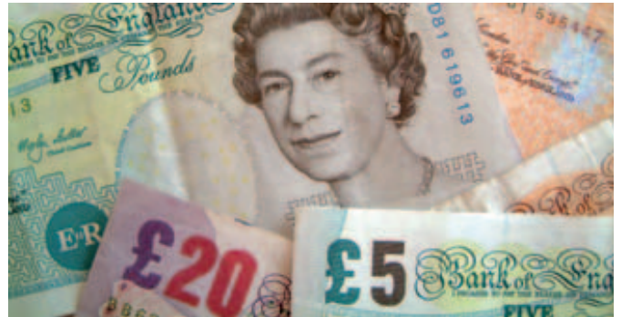
Das britische Pfund könnte bereits das Schlimmste hinter sich haben.

Somit kann man festhalten, dass die Commercials auf einem etwas höheren Preisniveau als im Januar/Februar 2008 eine größere Netto-Long-Positionierung besitzen, die Kleinspekulanten hingegen skeptischer positioniert sind. Diese Divergenz bei der Positionierung der beiden Handelgruppen im Verhältnis zur Preisentwicklung ist als eine bullische Divergenz anzusehen, die für steigende Kurse beim Britischen Pfund gegenüber dem US-Dollar spricht.