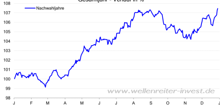
Dow Jones Index - Durchschnittsverlauf Nachwahljahre seit 1897 Gesamtjahr - Verlauf in %