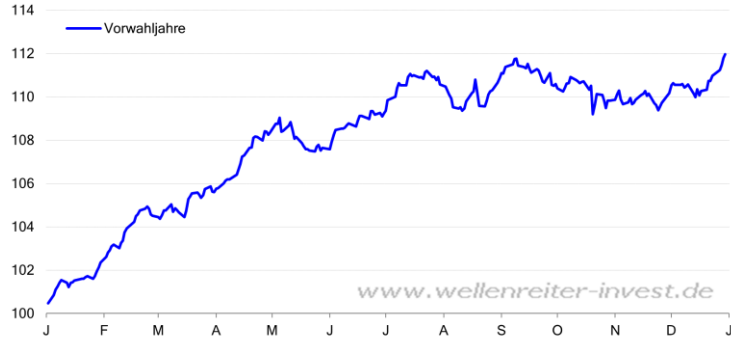
Dow Jones Index - Durchschnittsverlauf Vorwahljahre seit 1899 Verlauf in %