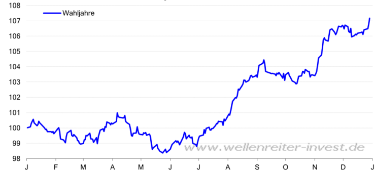
Dow Jones Index - Durchschnittsverlauf Wahljahre ab 1900 Gesamtjahr - Verlauf in %